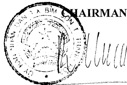
Bui Huy Hung