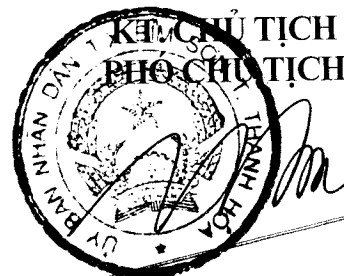
Tổng Thanh Bình