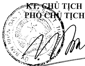
Tổng Thanh Bình